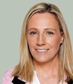
サマースクール校長

2025年の夏、イギリスの全寮制小学校、 オールド・バッケナム・ホールに皆さまを お迎えできることを大変嬉しく思います。 このサマースクールの最大の特徴は伝統的な イギリスのボーディングスクールで、 英語を学び、文化に触れながら、 イギリスの子どもたちと共に遊ぶ機会を得ることです。 小学校教諭の資格を持つ私は、キャリアの大半を ボーディングスクールで過ごしてきました。 寄宿舎ならではの楽しい生活をサマースクールに 参加する子どもたち全員と分かち合い、 お子さまの英語力向上だけでなく、 自立を促すプログラムにしたいと思います。